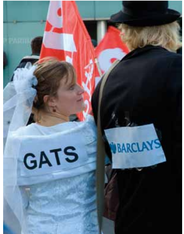
Protestkundgebung gegen Einfluss der Banken auf Handelsabkommen, Frankreich.

Die Verhandlungsführer bei den Handelsgesprächen und die sie unterstützenden Unternehmen behaupten oft, dass solche vorgeschlagenen Einschränkungen das „Recht auf Regulierung“ und auf Einführung neuer Regelungen anerkennen, aber dies ist irreführend. Das angebliche „Recht auf Regulierung“ kann nur in Übereinstimmung mit den im Abkommen festgelegten Verpflichtungen wahrgenommen werden, einschließlich der vorgeschlagenen Einschränkungen der innerstaatlichen Regelungen. 47 Auch wenn den Regierungen weiterhin überlassen bleibt, welche Ziele sie mit ihren Regulierungsmaßnahmen erreichen wollen, so bleiben die eingesetzten Mittel doch angreifbar und der Kontrolle des Streitschlichtungspanels unterworfen. 48