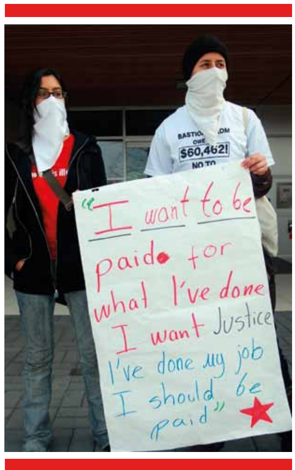
TISA bringt WanderarbeitnehmerInnen um ihre Rechte.

Von Bedeutung ist hier, dass die Modus 4-Verpflichtungen den Arbeitskräften keine Möglichkeiten bieten, einzuwandern oder einen Wohnsitz oder die Staatsangehörigkeit in dem Aufnahmeland zu erwerben. Ausländische Arbeitskräfte müssen nach Abschluss der Arbeiten oder nach Ablauf ihrer Aufenthaltserlaubnis im Gastland in ihre Heimatländer zurückkehren. Diese prekäre Situation macht die Arbeitnehmer abhängig vom guten Willen der Arbeitgeber. Falls sie ihre Arbeit verlieren, müssen sie das Aufnahmeland sofort verlassen. Trotz dieser Gefährdung wurden laut Berichten der US-Verhandlungsteams keine Vorschläge unterbreitet, im TiSA durchsetzbare Arbeitsnormen oder Arbeitsrechte zu verankern. 51