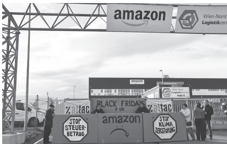
Attac Aktion beim Amazon-Verteilzentrum in Grobbersdorf (2019)

In Deutschland ist es seit 2020 verboten, Neuware zu zerstören – geahndet wird dies jedoch bislang nicht, da man sich auf keine Bußgelder festgelegt hatte. NDR-Recherchen zufolge zerschneidet Amazon inzwischen aber vorsichtshalber Ware bevor sie in die Entsorgung gelangt – um dieses Verbot zu umgehen. 51 Auch in Österreich wurde ein solches Gesetz 2023 vorgeschlagen, konnte jedoch bislang keine Mehrheit finden. 52