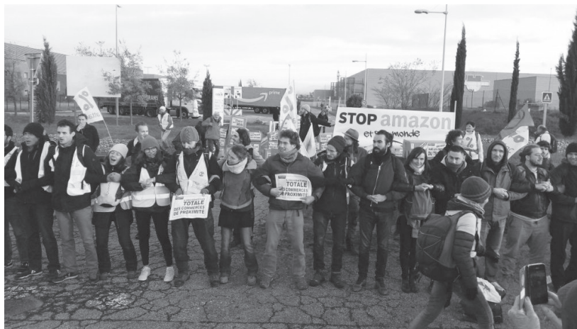
Attac Frankreich blockiert ein Amazon Lager (2019)

Außerdem verschleiern sie, dass zum Großteil fossile Energie zum Betrieb der Data Centers verwendet wird, da man RECs von überall zukaufen kann. In Summe stammen nur circa 22 Prozent der von Amazon Datacentern verbrauchten Energie tatsächlich aus emissionslosen Quellen. 58