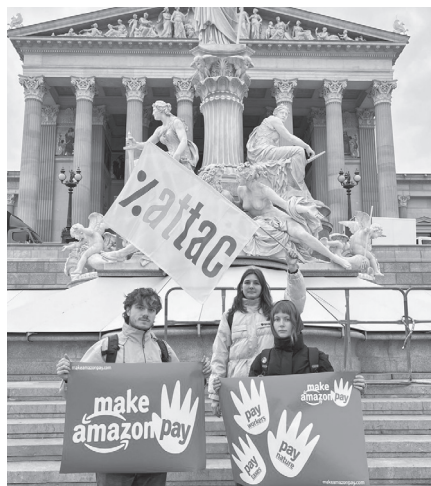
Attac Protest gegen Amazon vor dem Parlament (2024)

Kritiker*innen – wie die deutsche Gewerkschaft Verdi, Umweltschutzorganisation und Medien – warnen, dass der Konzern so die gesamte Lieferkette dominieren könnte, was zu einer Verdrängung kleinerer Wettbewerber*innen und einer Verschärfung des Drucks auf die Arbeitsmärkte führen könnte. Ohne wirksame regulatorische Eingriffe könnte Amazon sein Ziel erreichen, die Handelsinfrastruktur des 21. Jahrhunderts vollständig zu beherrschen.